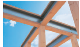
テクノストラクチャー 検索

テクノストラクチャーの家は木と鉄の複合梁「テクノビーム」と高強度オリジナル接合金具を使用し、さらに耐震実験や構造計算など、最先端の技術を導入した工法「テクノストラクチャー」を採用。また、各種補助金等の優遇制度を利用できるメリットがあります。